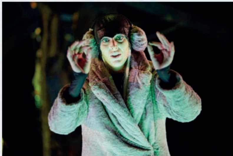
— La Belle au bois dormant

Empruntant les codes qui font notre monde, Jean-Michel Rabeux signe une Belle au bois dormant étonnante, pour jeunes et vieux adultes. On en redemande.