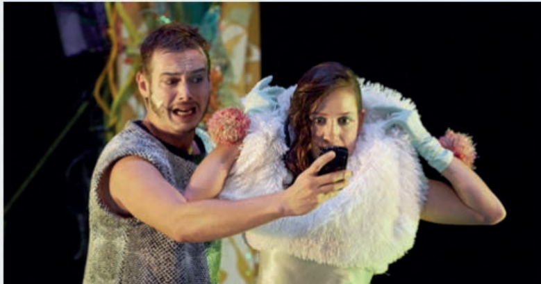
— La Belle au bois dormant

Avec son écriture, Jean-Michel Rabeux donne la parole aux figures qui peuplent les contes. Il s'amuse à ouvrir des portes vers les autres histoires de nos enfances et invite, pour l'occasion, un lion et un loup pour réveiller la Belle endormie. La forêt est toujours présente et la marmite de la fin du conte aussi. La fantasmagorie est, elle aussi, de la partie lorsque la petite fée prend dans sa main le cœur du Prince pour voir qui il est vraiment. Belle métaphore des à-priori si seule l'apparence est prise en compte pour savoir qui se trouve en face de nous.