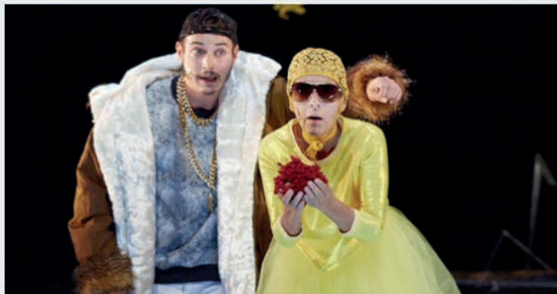
— La Belle au bois dormant

Avec son écriture, Jean-Michel Rabeux donne la parole aux figures qui peuplent les contes. Il s'amuse à ouvrir des portes vers les autres histoires de nos enfances et invite, pour l'occasion, un lion et un loup pour réveiller la Belle endormie. La forêt est toujours présente et la marmite de la fin du conte aussi. La fantasmagorie est, elle aussi, de la partie lorsque la petite fée prend dans sa main le cœur du Prince pour voir qui il est vraiment. Belle métaphore des à-priori si seule l'apparence est prise en compte pour savoir qui se trouve en face de nous.