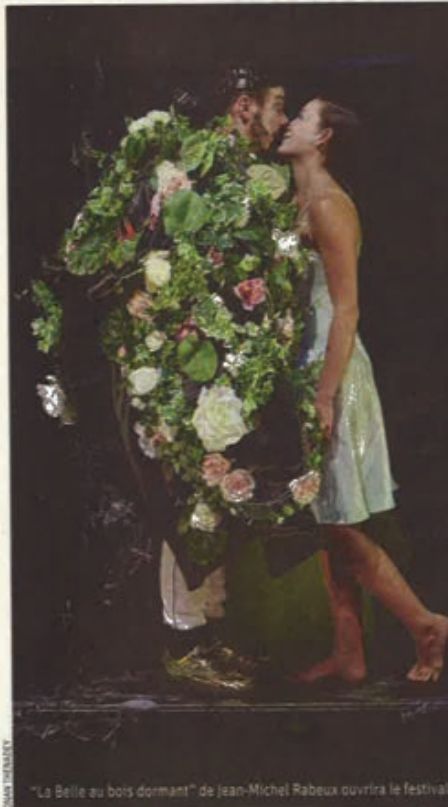
"La Belle au bois dormant" de Jean-Michel Rabeux ouvrira le festival "Météores".